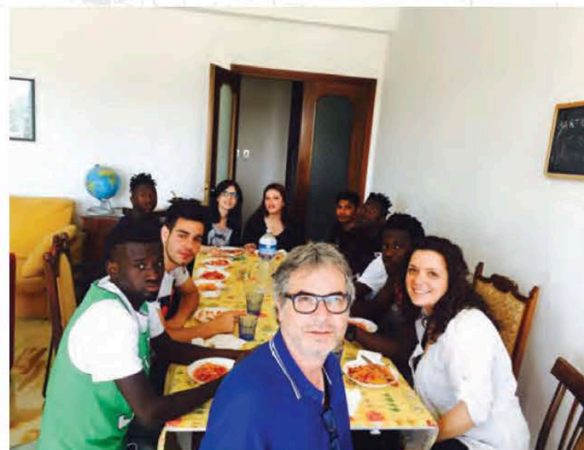
Ogni volta che avete fatto queste cose a uno solo di questi miei fratelli più piccoli, l'avete fatto a me (Mt 25,40)